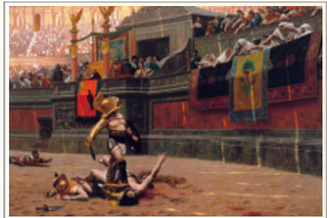
Jean-Léon Gérôme, Pollice Verso , 1872