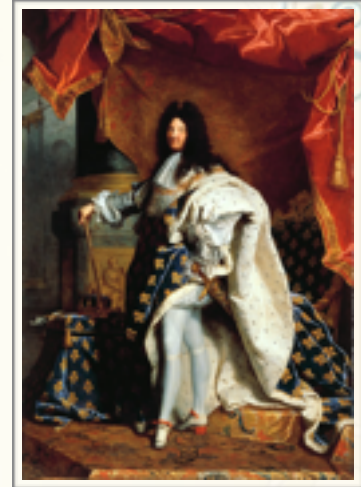
Louis XIV en costume de sacre , Hyacinthe Rigaud, 1701

Quelques références artistiques sur l'académisme :