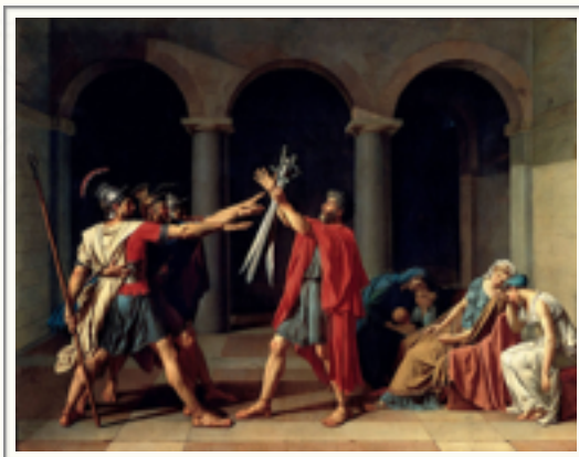
Le serment des Horaces , Jacques Louis David, 1784 - 1785